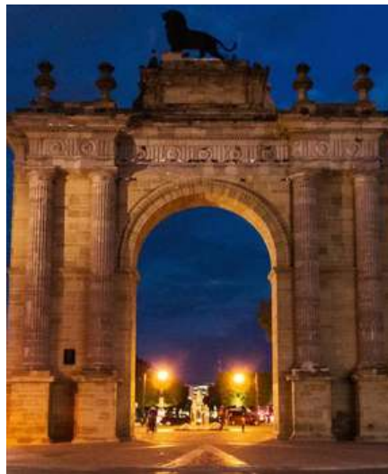
ARCO DE LA CALZADA

Miércoles 28 de junio de 2023 Costo por persona: $600.00 mxn